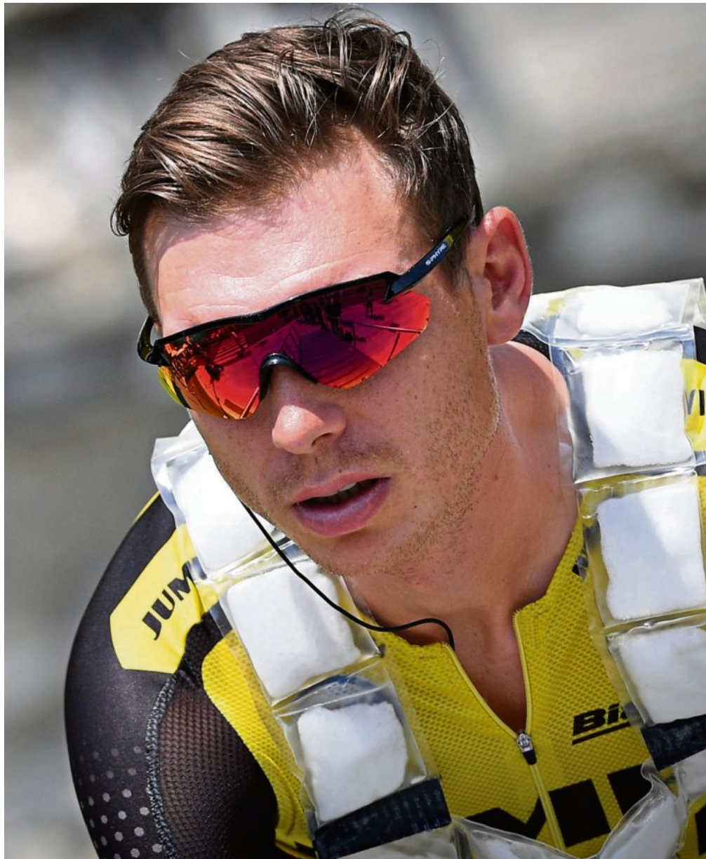
Viermaliger Weltmeister im Einzelzeitfahren: Tony Martin.

Sie sind bereits 36 und haben vieles im Radsport erlebt. Was treibt Sie derzeit noch an, und wie weit planen Sie Ihre Karriere noch – gibt es noch einen Fixpunkt? Die Stürze sind immer heftiger geworden. Mit 36 überlegt man schon, wie lange