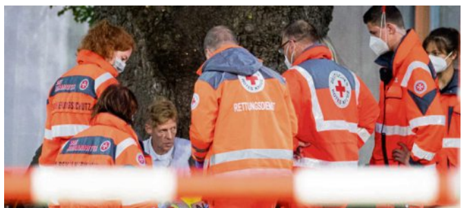
Markus Ehning musste ärztlich versorgt werden.

Ehning war nach seinem Sturz auf dem Abreiteplatz sehr benommen. „Er wirkte etwas geschockt“, meinte Becker. Der Bundestrainer lobte ausdrücklich das schnelle Eingreifen der Sanitäter, die den verunglückten Reiter versorgten. Ehning wurde vorsorglich in eine Klinik gebracht. Am Freitagmittag gab er Entwarnung, sagte jedoch alle weiteren Starts beim CHIO in Aachen vorsorglich ab. dpa