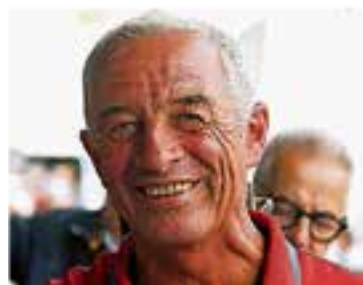
Bundestrainer Hans Melzer.