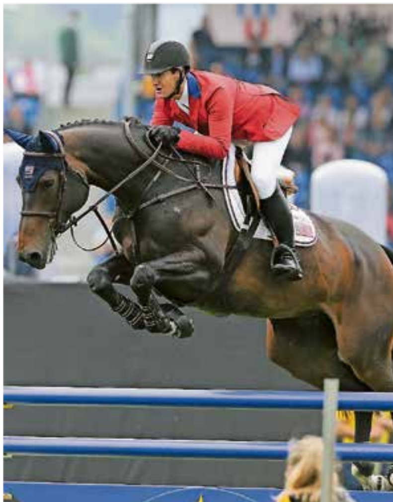
Der Sieger des Preises von NRW im vergangenen Jahr: der US-Amerikaner McLain Ward, hier auf Noche de Ronda.