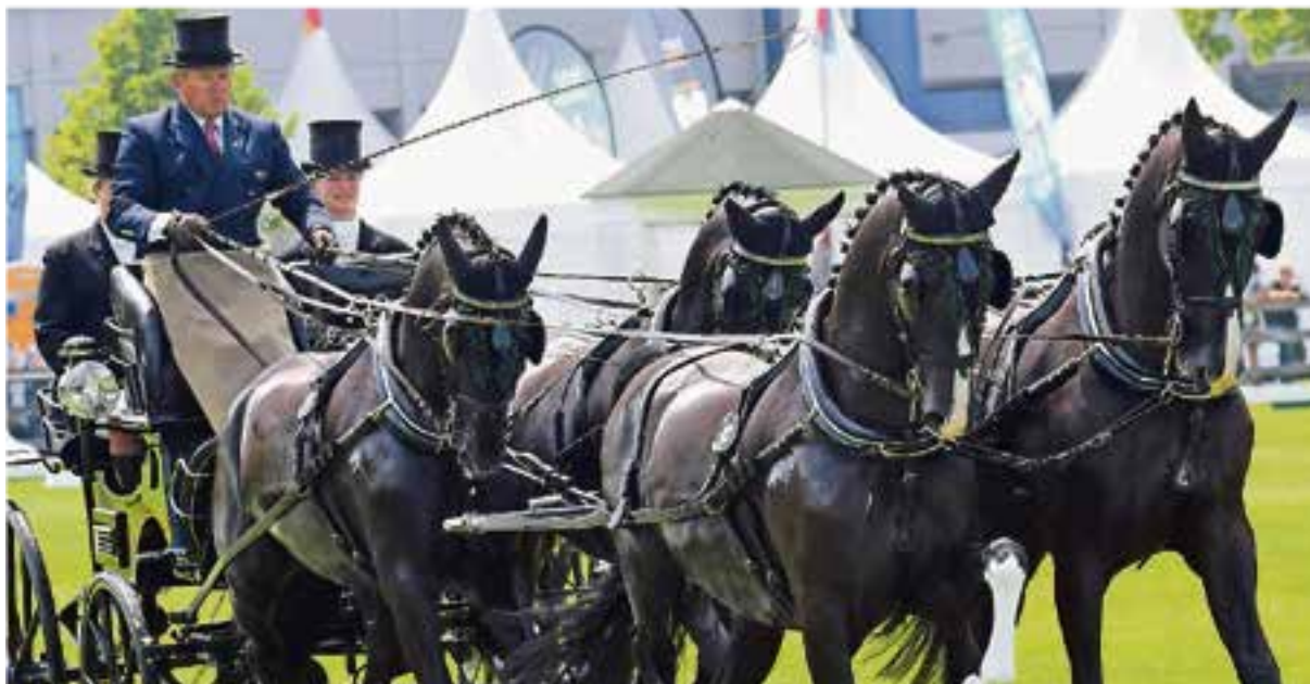
Ästhetik wie aus einem Guss: Boyd Exell fährt die mit Abstand beste Dressur und zeigt anschließend Daumen hoch.