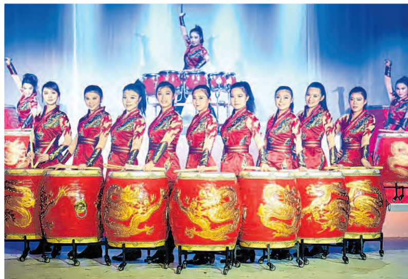
Laut und spektakulär: Die zwölf Frauen mit ihren gewaltigen Trommeln sind die „Manao – Drums of China“.

den menschlichen und tierischen Mitwirkenden eindrucksvoll auf das Geläuf in der Soers gebracht – wie gehabt, wenn das Wetter mitspielt. Den akustischen Knaller bildet die Darbietung der Gruppe „Manao – Drums of China“. Die zwölf Frauen mit ihren Riesentrommeln beeindruckten bereits bei der Eröffnungsfeier der Olympischen Spiele in Peking vor zehn Jahren. Den Schlusspunkt setzt – wie kann es anders sein – ein traditionelles chinesisches Feuerwerk, das den Himmel in der Soers erstrahlen lässt. (rom)